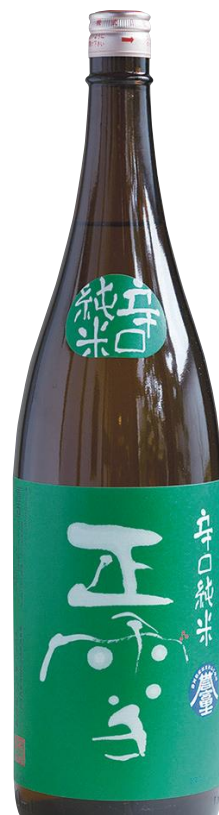
辛口純米 誉富士 2,695円(1800ml) 1,348円(720ml)