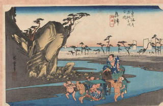
おきつ おきつがわ 「奥津 興津川」 興津川をカゴに乗って渡る力士と、馬に乗る力士の旅姿がユーモラスに描かれています。興津川の川底の浅さが、ゆったりとした印象を与えてくれます。