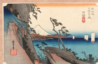
ゆい さつらじん 「由井 薩埵嶺」 難所と呼ばれた薩埵峠を超え、駿河湾と富士山を望む絶景が描かれた一枚。小さく見える旅人と断崖の荒々しさ、穏やかな海の対比が素晴らしいですね。