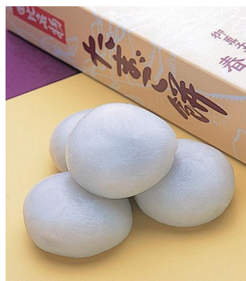
「たまご餅」864円(10個入り)