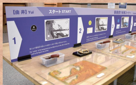
版画摺り体験コーナー 300円

美術館では「東海道五拾三次之内」をはじめ、浮世絵師・歌川広重の風景版画を中心に約1400点を数える名画を所蔵しています。バラエティに富んだ企画展も注目です。館内には版画摺り体験コーナーも。