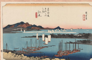
えじり みほえんぼう 「江尻 三保遠望」 行き交う舟の多さから、溢れる活気が伝わってきますね。船の向こうには、三保松原も見えています。

美術館では「東海道五拾三次之内」をはじめ、浮世絵師・歌川広重の風景版画を中心に約1400点を数える名画を所蔵しています。バラエティに富んだ企画展も注目です。館内には版画摺り体験コーナーも。