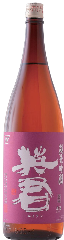
紫の英君 3,410円(1800ml) 1,705円(720ml)