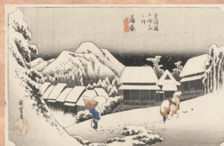
かんばら よるのゆき 「蒲原 夜之雪」 しんしんと降り積もる大雪の蒲原宿。雪の柔らかさがグレーの濃淡で表されていて、他の浮世絵と比べても格段に強い印象を残します。