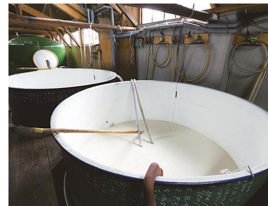
※ご来店の際は前もってお電話ください。酒蔵見学は時期により応相談