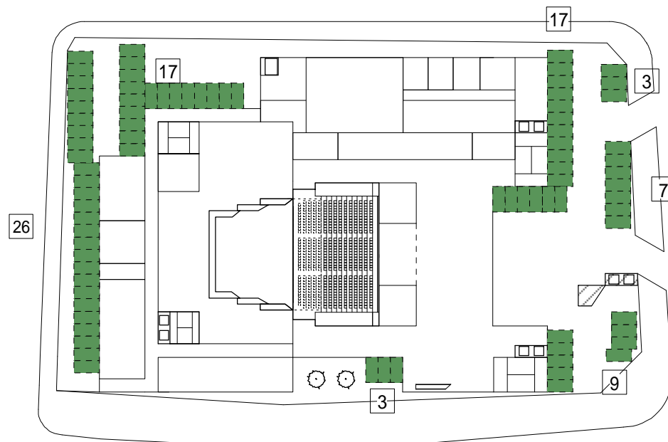
駐車場・駐輪場 配置図