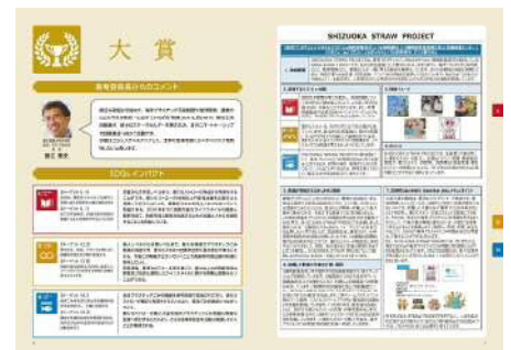
〈令和3年度 静岡市SDGs連携アワード 事例集〉