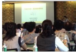
食中毒予防講習会