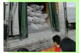
しずま漁業見学事業