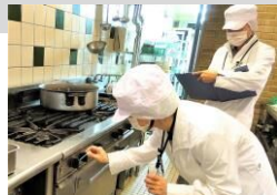
飲食店の立入検査