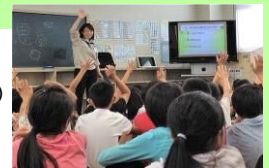
小学校での食の安全教室