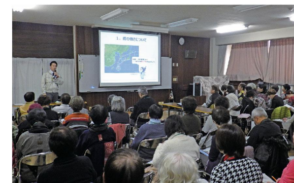
過去に開催した市政出前講座

また、浸水ひなん地図の活用方法について、市の職員が地域に出向き説明する市政出前講座を実施しています。防災学習にぜひご利用ください。