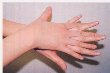
2. 手の甲を伸ばすように洗う