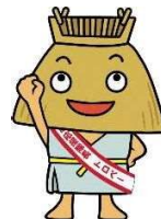
駿河区応援隊長 トロパー