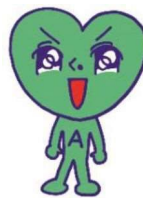
葵区PRキャラクター あおいくん