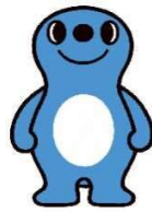
清水区広報キャラクター シズラ

静岡市では、最上位の行政計画である「第4次静岡市総合計画」の策定を進めています。令和4年3月には、計画の骨子案を公表し、1回目のパブリックコメントを実施しました。今回は、市民の皆さんからいただいた様々なご意見を反映させた計画案について、2回目のパブリックコメントを実施します。