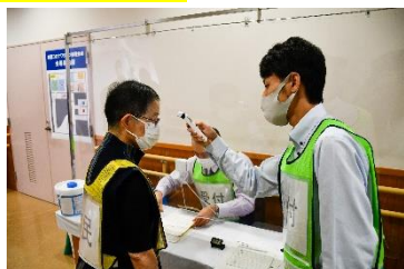
① 受理 检查体温、确认本人证明材料、接种券及预约状况等。