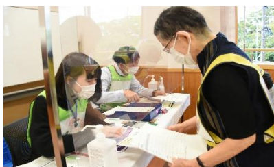
⑤ 发行接种完毕证明 在接种完毕证上贴上接种的疫苗贴纸，并记载接种日期・接种场所。