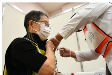
④ 疫苗接种 由医生或护士进行疫苗接种 注射在从肩膀3根手指以下的地方