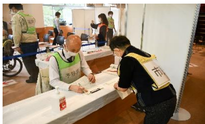
② 确认予诊票 确认记载项目是否齐全等。 ※若是第二次，则确认接种间隔及确认第一次接种的疫苗。