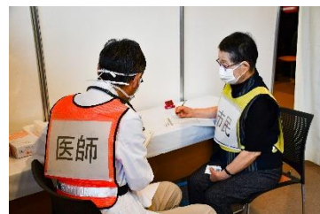
③ 予诊 疫苗接种前确认身体状况及平时有的病症等，由医生等进行诊察。