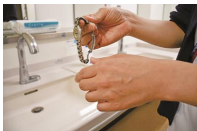
① 取下戒指和手表、 用流动水淋湿后涂上肥皂