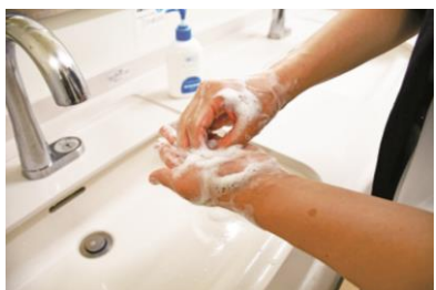
③ 充分揉搓 指间、指尖、手腕等处