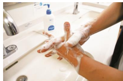
③ 充分揉搓 指间、指尖、手腕等处