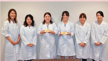
栄養科のみなさん

平成28年、新たに「ウェルビーSweets」を開発しました。彩りよく、見た目も常食に近づけ、高齢者の食欲を高めるスイーツ(桜餅、モンブラン、あんみつ)です。