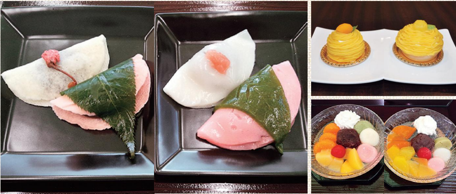
左：常食、右：ウェルビーソフト食