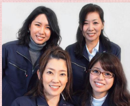
山崎製作所のみなさん