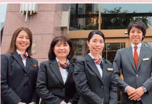
ホテルクエスト清水 スタッフのみなさん