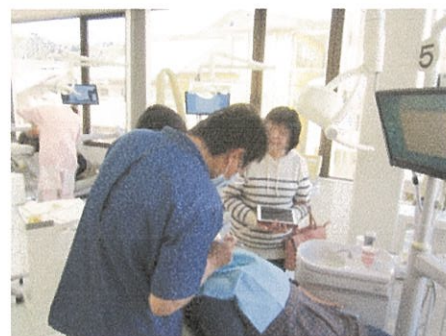
移行先歯科医院での診療