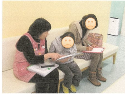
救急歯科センター待合室 HPSからのプレパレーション