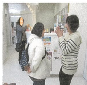
移行先歯科医院待合室 終了後出来たことを認める