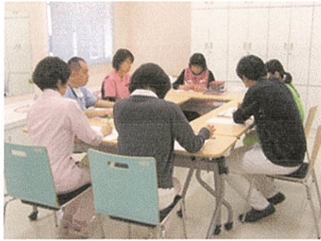
地域移行に向けてのミーティング