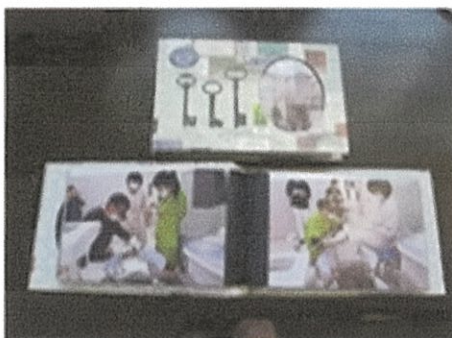
ソーシャル・ストーリーブック