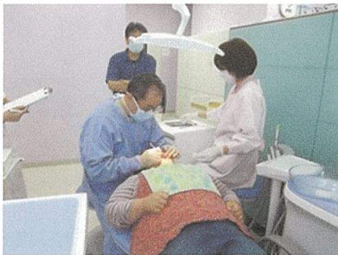
歯科センター医師による診療