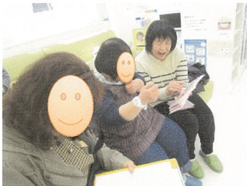
移行先歯科医院待合室 HPSからの写真ブックによる プレパレーション