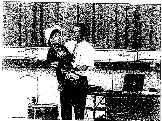
腹話術人形「ケンちゃん」