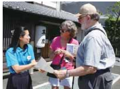
観光ボランティアガイド