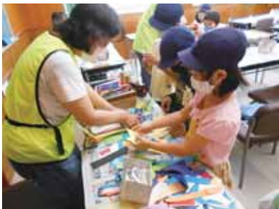
学校でのボランティア活動