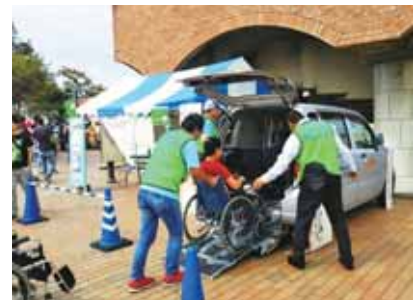
運転ボランティア