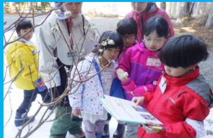
植物の特徴をよく観察して考える冬の森探検!