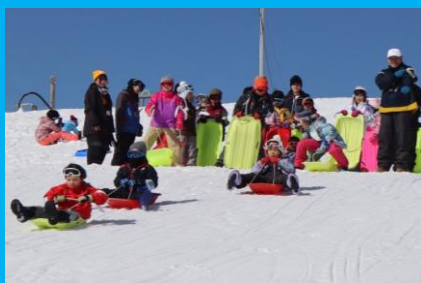
滑った時の風が気持ちいい! そり遊び!