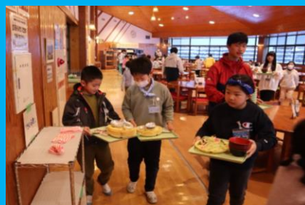
朝ごはんの食器の返却 班で協力してできたよ!