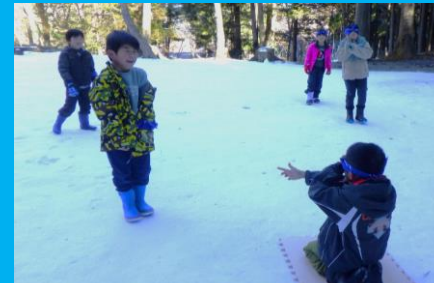
いっぱい笑ったね! リーダースレク「いねむりおじさん」