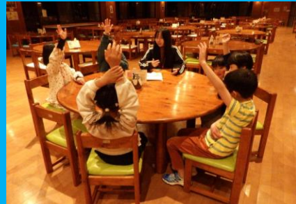
班で1日の振り返り! どんなことを頑張れたかな?