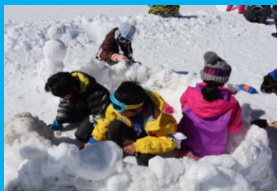
冷たい雪を感じながら大きなかまくらを作るぞお!