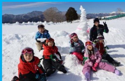
見て見て! 6班自慢の雪の造形が完成!