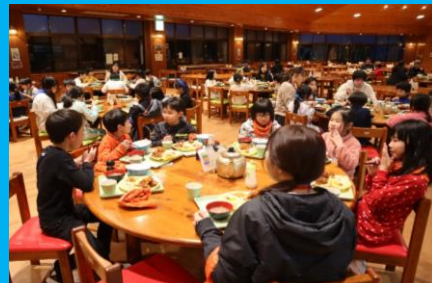
たくさん動いた後に食べる夕食はおいしいね!