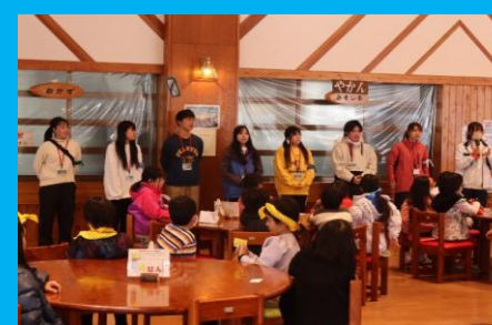
リーダーたちと感謝を伝え合った終わりの会