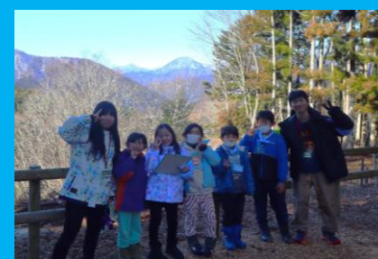
南アルプスを背景に ハイ! チーズ!