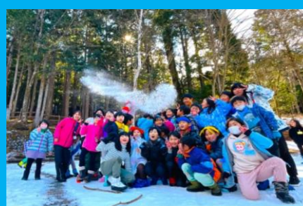
頭上に舞った雪と一緒に思い出の一枚!