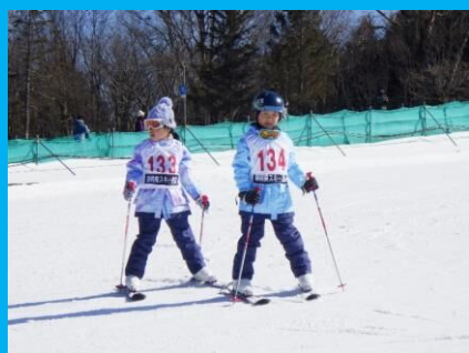
上手に滑れるようになると楽しさ倍増！