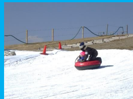
スノーチューブで斜面を滑走！スリル満点！