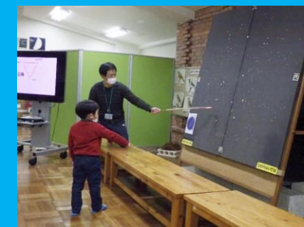
夜には井川の冬の星空について、所員がレクチャー！