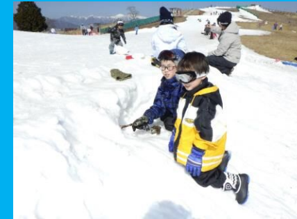
何を作ろうかな？わくわくの雪の造形遊び！