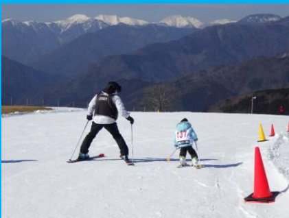
初スキー！先生と一緒に斜面へ！