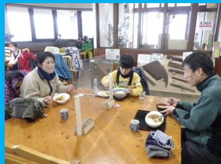
レストハウスで昼食！あったかくておいしい！