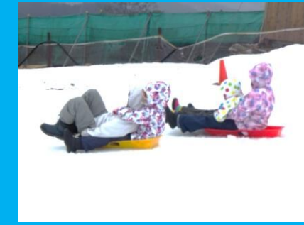
家族でそり遊び！どっちが早いかな？