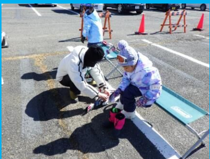
スキー靴の履き方も教わったよ！