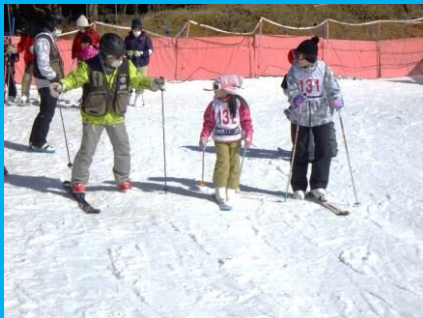
スキーレッスンに参加！一本スキーに挑戦！