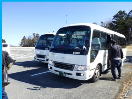
冬道も東静岡駅からの送迎バスで安心！