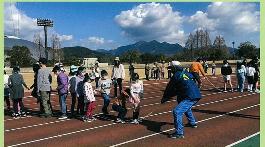
↑長縄跳びはタイミングが大事!