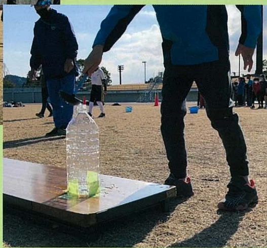
お玉で水を運ぶリレーは → なかなか水が溜まらず大苦戦!