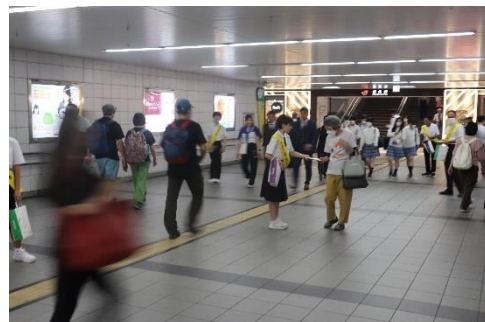
<城内中・大里中生徒の配布の様子>