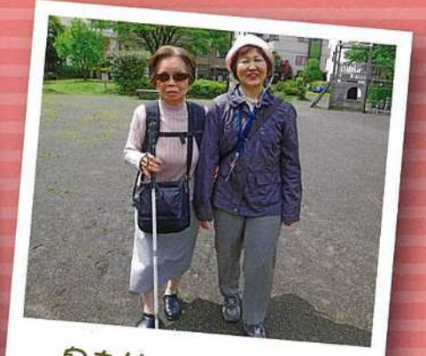
息もピッタリの二人!