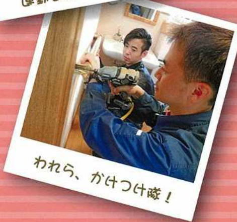
われら、かけつけ隊!