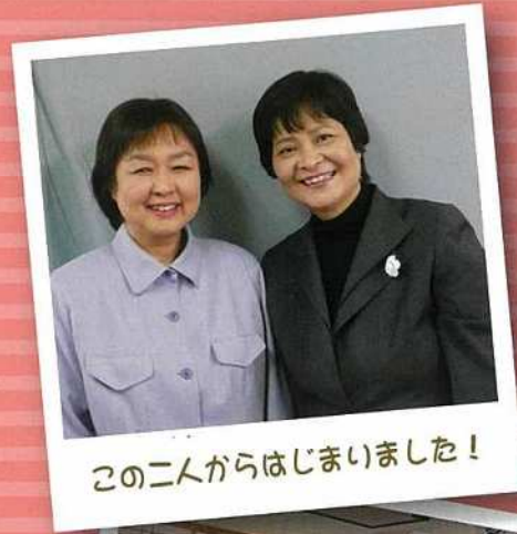
この二人からはじまりました!

〒420-0882 静岡市葵区安東1丁目23-12 TEL 054(209)0700