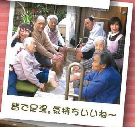
皆で足湯。気持ちいいね~