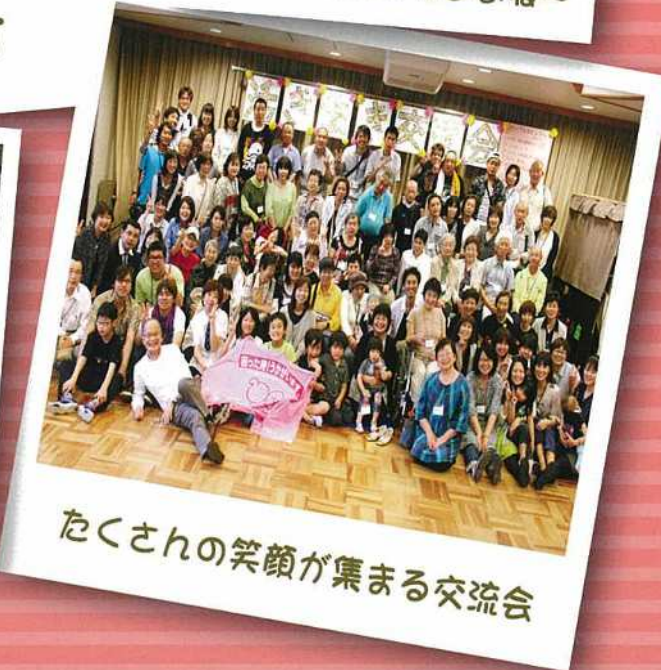
たくさんの笑顔が集まる交流会