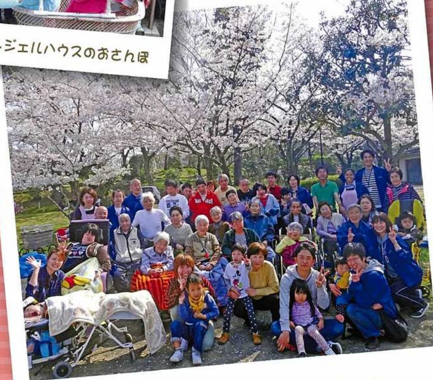
近くの公園へおでかけ