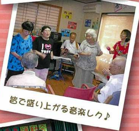
皆で盛り上がる音楽しく!