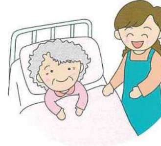
入院中から在宅までの介護