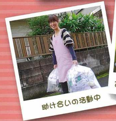
助け合いの活動中