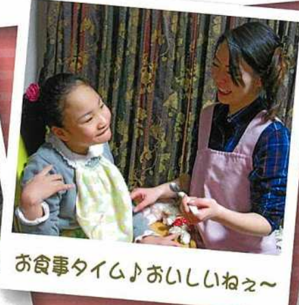
お食事タイム♪おいしいね~