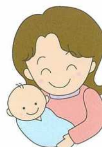
乳幼児・障がい児のお世話