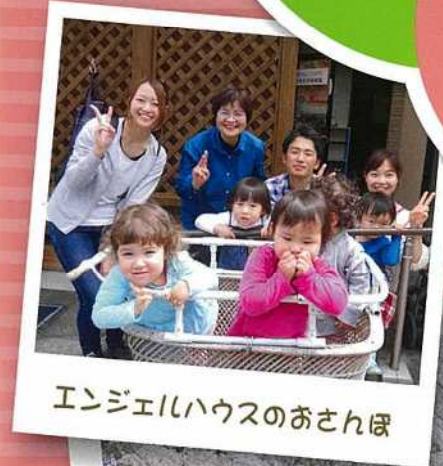
エンジェルハウスのおさんぽ