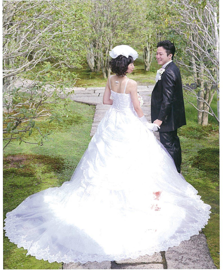
静岡市立芹沢銈介美術館 Serizawa Keisuke Art Museum