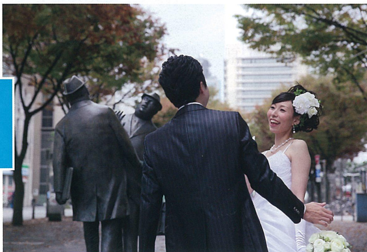
別名「青葉シンボルロード」。 様々なモニュメントを 撮影にうまく利用して。