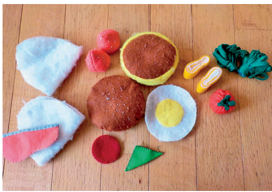
まい先生手作りのままごと具材