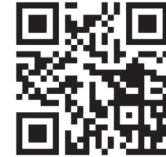
静岡市立こども園の紹介 ぜひ見てね！