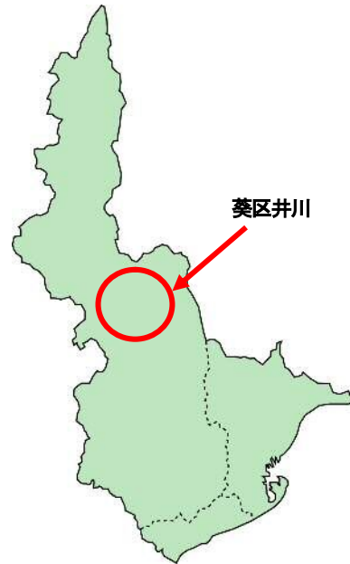
令和元年度 整備予定地 地図①

所 在：葵区井川 長尾地区 面 積：約 13ha (3か年 合計約 30～45ha を計画) 所 有：私有林 現 況：スギ・ヒノキ、雑木 整備方法：伐捨間伐 事業期間：平成 30～令和 2 年度 (3か年) (2018～2020 年度)