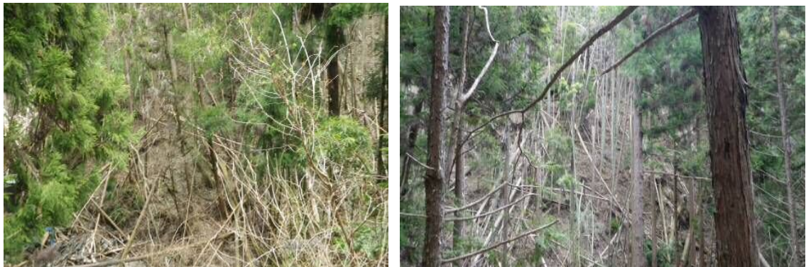
※特に雪害がある箇所の写真