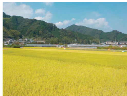
市街地郊外の水田

市街地郊外の平坦部には一団の水田などが広がり、良好な環境や景観の形成に寄与しています。