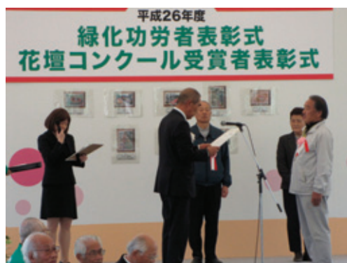
花壇コンクール表彰式