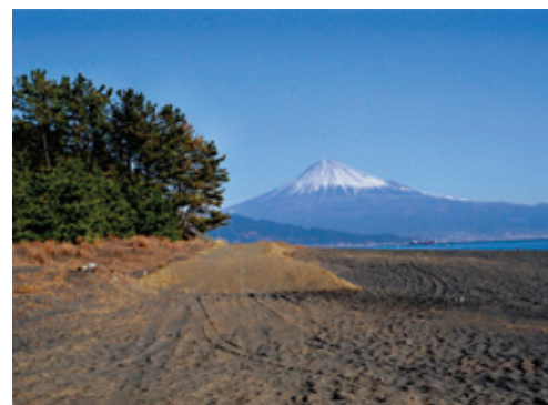
世界文化遺産富士山構成資産三保松原

清水区に国際拠点港湾があり、街と水辺が一体となった環境・景観が形成されています。