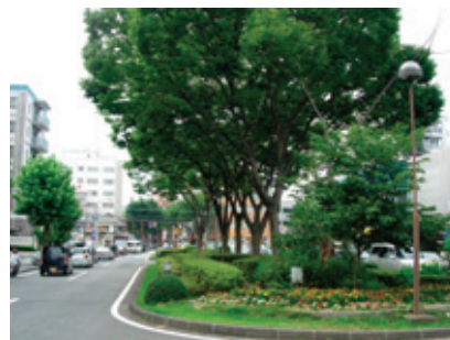
鷹匠中央通り（つつじ通り）

樹種では、高木はケヤキ、クロガネモチなどが、中低木はサツキ、サザンカなどが多くの路線に植栽されています。