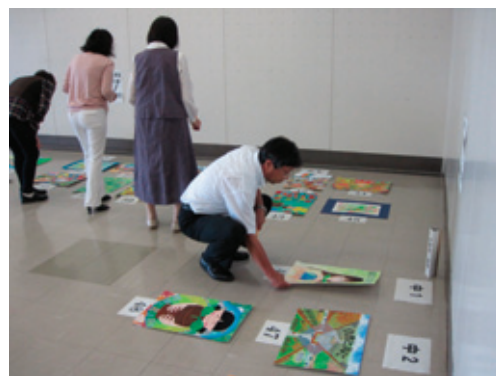
緑化作品コンクール本審査