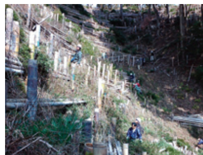
里山の放任竹林伐採、植樹

地権者の高齢化による管理不足などにより荒廃の進む里山・森林の環境・景観を保全するため、近年、里山・森林保全の市民活動団体が数多く組織されており、有度山、賤機山、谷津山、興津川流域などにおいて放任竹林伐採、森林の維持管理などの活動が行われています。