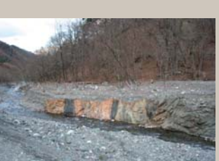
中央構造線・安康露頭

長野県下伊那郡の北東部に位置し、長野県と静岡県の7市町村に囲まれた村です。東には3,000m級の南アルプスの山々がそびえ立ち、西は伊那山地に隔てられた農耕地の少ない典型的な山村です。本村の中央部を中央構造線が南北に縦断していることで、地質学的にも知られていて、村内に中央構造線博物館があります。赤石岳に源を発する小渋川上流や鳥倉、塩川は、南アルプス中部の3,000m峰である塩見岳、荒川岳、赤石岳への登山口になります。