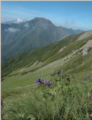
南アルプスの景観