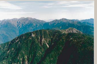
光岳と南アルプスの山々

川根本町は静岡県の中央部を流れる大井川中流域、南アルプス国立公園の最南端に位置し、町の北部には光岳など2,000～2,600m級の山々が連なっています。町域の90%以上が山林ですが、大井川に沿った山間斜面を利用しての茶の栽培が盛んで、良質な川根茶の産地として知られています。なお、光岳の南西側は本州唯一の原生自然環境保全地域に指定されています。