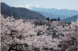
高遠城址公園と仙丈ヶ岳