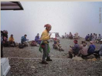
仙丈ヶ岳における環境教育