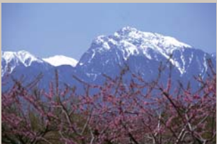
モモ畑と甲斐駒ヶ岳