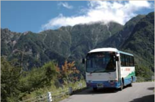
南アルプス林道バス

伊那市は長野県の南部に位置し、東に南アルプス、西に中央アルプスという3,000m級の2つのアルプスを有しています。「天下第一の桜」で知られる高遠城址公園からは、満開の桜越しに雪を頂いた仙丈ヶ岳を望むことができます。古くから四季を通じ南アルプス登山の長野県玄関口として、多くの岳人に親しまれています。1980年から北沢峠まで市営林道バスの運行が始まり、登山者しか見ることができなかった雄大な大自然を目当てに、幅広い層の人たちが訪れています。