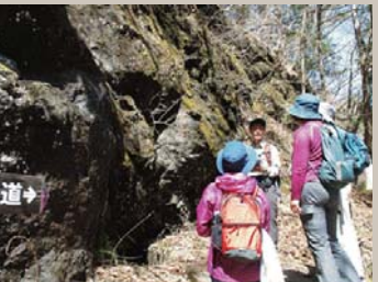
大柳川エコツアー

芦安地域を中心とする南アルプス市の自然を愛する全ての人達に対して、地域の人々との交流を通じた南アルプス山岳地域の環境保全及び適正利用に関する事業を行い、この地域の活性化に寄与しています。地域でなければできないガイドサービスとして、大柳川エコツアーと北岳でのキタダケソウ観察会を毎年行っています。