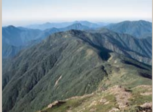
上河内岳から見た深南部の山々