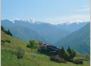
下栗の里から見た聖岳

飯田市は、3,000m級の山岳地帯からリング並木のある市街地まで、四季の変化に富む豊かな自然と優れた景観に恵まれています。南アルプスの山城は2005年に合併した旧上村地区と旧南信濃村地区の一部が含まれており、天竜川支流の遠山川上流にある西沢渡や易老渡が南アルプス南部山城の聖岳（3,013m）や茶臼岳（2,604m）の登山口になっています。