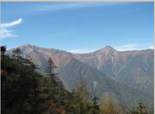
雨滝分岐から北岳、間ノ岳