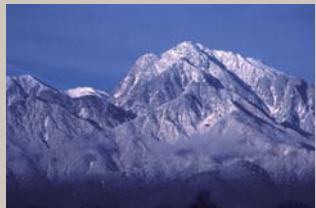
北杜市内から望む雪の甲斐駒ヶ岳

北杜市は山梨県北西部に位置し、南アルプス、ハケ岳など日本を代表する山岳景観に囲まれた文字どおり「杜のまち」です。市街からはゴツゴツとした甲斐駒ヶ岳（2,967m）の姿を見上げることができ、岳人試練の長い登りで知られる黒戸尾根の登山口でもあります。