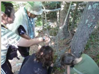
鳥森山（根島）におけるエコツアー（野生鳥獣の食害を調べる）