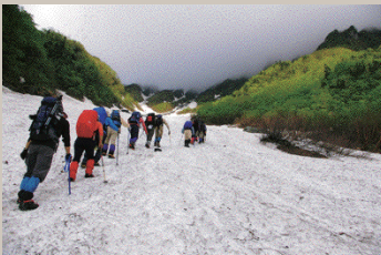
2007年度・キタダケソウ観察会