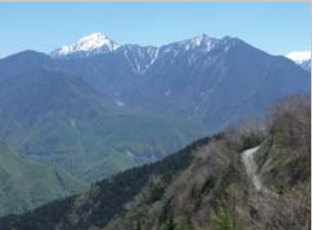
釜無川から甲斐駒ヶ岳・鋸岳

富士見町は長野県の東南部に位置し、釜無川上流の流路を挟んで山梨県北杜市と境を接し、ハケ岳と南アルプスに挟まれた標高1,000m前後の高原地帯にあります。南アルプス最北端の山・鋸岳（2,685m）を末端から縦走する時の登山口になります。