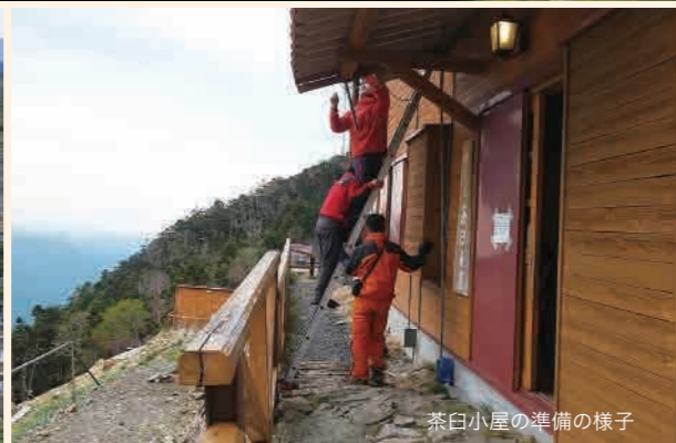
茶臼小屋の準備の様子

南アルプス南部では、この夏、3年ぶりに山小屋が営業を再開しました。 過去2年は、新型コロナウイルス感染症対策として、営業を見合わせていた静岡県と静岡市が所有する15軒の山小屋。静岡県が令和3年4月に策定した、南アルプスの山小屋の新型コロナウイルス感染症対応ガイドラインに基づき、宿泊利用を完全予約制とし、定員の半数以下の受け入れとすることで、営業を再開することになりました。(十山(株)が所有する二軒小屋ロッヂは営業休止) 令和元年には、約2万人に利用され、再開を待ちわびていた登山ファンも多いことでしょう。 各山小屋も、念入りの準備を重ねて、営業再開の日を迎えました。久しぶりの営業とあり、山小屋管理人さんからは、登山者を受け入れられる喜びや安堵の声も聞かれました。今シーズンから体制が変わった山小屋もあり、今後どのような特色のある山小屋になっていくのか、また、どのような取り組みが行われるのか、期待されます。 各山小屋は「自然と人の共生」が重要なテーマである、南アルプスユネスコエコパーク登録地域内に位置します。環境保全と小屋の営業とのバランスを取りながら、登山者たちの安全を見守る存在として、大きな役目を果たしてくれています。 ようやく訪れた、本格的な登山シーズン。各地からの登山者が、南アルプスの豊かで貴重な自然に触れ、たくさん魅力を満喫してくれることを願っています。