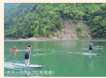
カヌーやサップにも挑戦!

5月10日(火)、本川根中の2年生と本校の中学生3名とで、接岨湖にてボート体験をしました。はじめはみんなの漕ぐタイミングがバラバラで、なかなかボートが前に進まなかったけれど、だんだん声が出て漕ぐタイミングがそろい、帰りは速くボートを進めることができました。 きれいな景色を楽しみながら、ボート以外にもカヌーやサップにも挑戦しました。体験の最後は、接岨湖の中にみんなで飛び込みました。湖の水はとても冷たかったけれど、本川根中の友達とは少し距離が縮まったと思います。