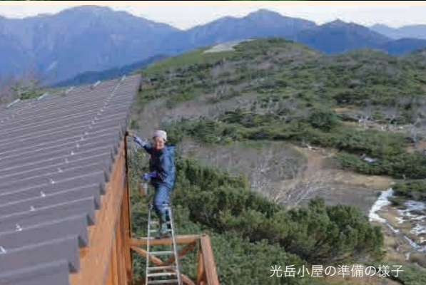
光岳小屋の準備の様子