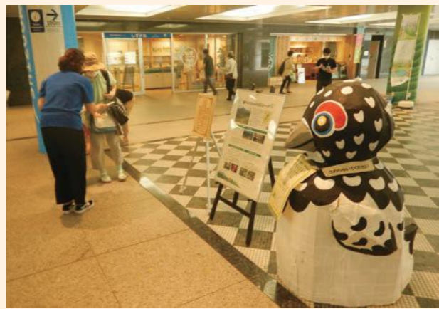
エコパークPR活動の様子

令和3年6月12日で南アルプスユネスコエコパークは、登録7周年を迎えました。登録記念として、11日にJR静岡駅北口地下広場イベントスペースでエコパークのPR活動を静岡市と川根本町の職員で行いました。当日は、たくさんの方のイラストのポストカードやエコ