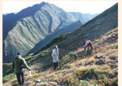
秋の防鹿柵撤去の様子

小屋の周辺をはじめ今まで被害の少なかった場所でも食害が見られました。今後も引き続き、防鹿柵の維持などの対策が求められています。