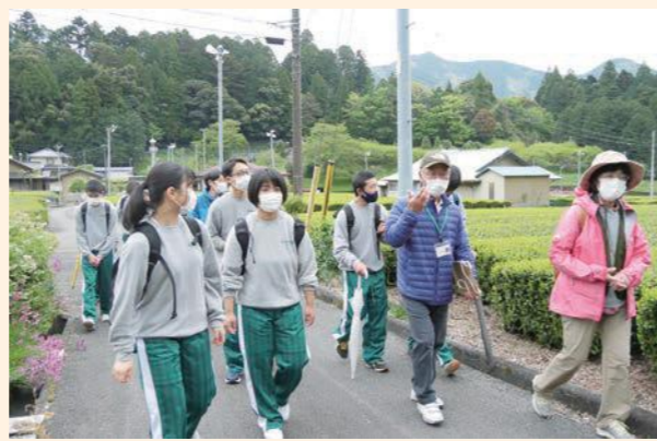
町内をめぐるフィールドワークの様子