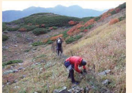
丁寧に作業していきます