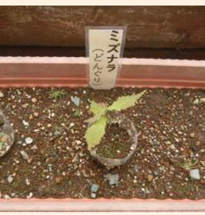
ミズナラの試験育成(井川支所)

3年後の令和6年には、南アルプスユネスコエコパークは登録10周年を迎えます。これからも私たちに多くの恵みをもたらす豊かな自然を登録地域の方々と一緒に守るため、井川小中学校と川根本町の中学校とのエコパークの学習に