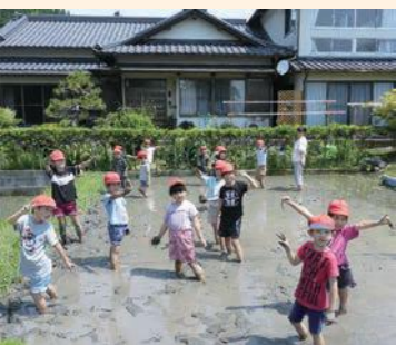
楽しみながら学びます

エコティかわねでは、町内の小中学校や高校に向けた出前講座を行っています。内容は町内をめぐるフィールドワークやトレッキング、田植え、稲刈り体験など様々です。講座内容は学校の先生方と話し合ってから決めますが、「町内に住んでいても行ったことがない場所がある」、「井川線に乗ったことがない」、「地域をよく知らない」、「田んぼがある地区に住んでいるけど田植えをやったことがない」など、住んでいても知らないことがたくさんあるから体験させたいという希望がとても多