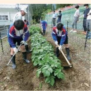
丹精こめて作ります

井川小中学校は、9年間の学びの軸に環境教育を位置付け推進しています。令和3年度は、南アルプスユネスコエコパークにある小中学校として、南アルプスの大自然や自然と人のかかわりについて学習していきます。まず、スタートとして、「南アルプスユネスコエコパーク井川自然の家」から、多くの鳥や植物、昆虫を