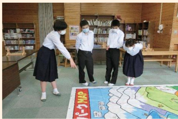
南アルプスの自然や人との関わりについてみんなで学びます