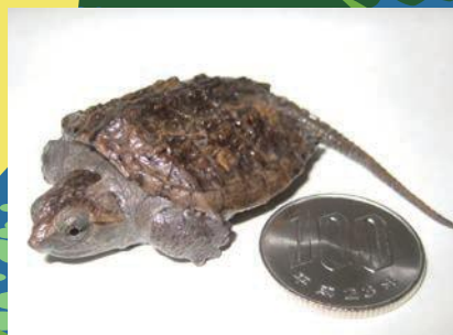
カミツキガメの幼体

河川・湖沼・水路・湿地などに生息。緩やかな流れの止水域の水生植物が多い場所を好む。汽水域にも生息。北米原産。