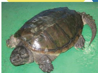
甲羅の色や形は生息環境によって異なります