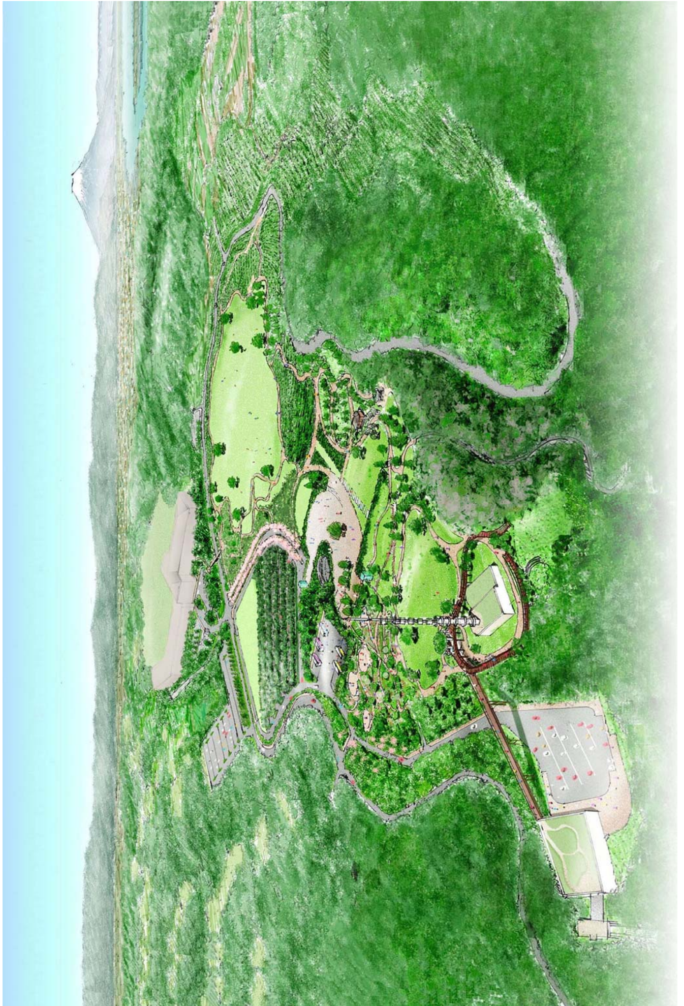
全体整備イメージ（吟望台から日本平ホテル方向を望む）