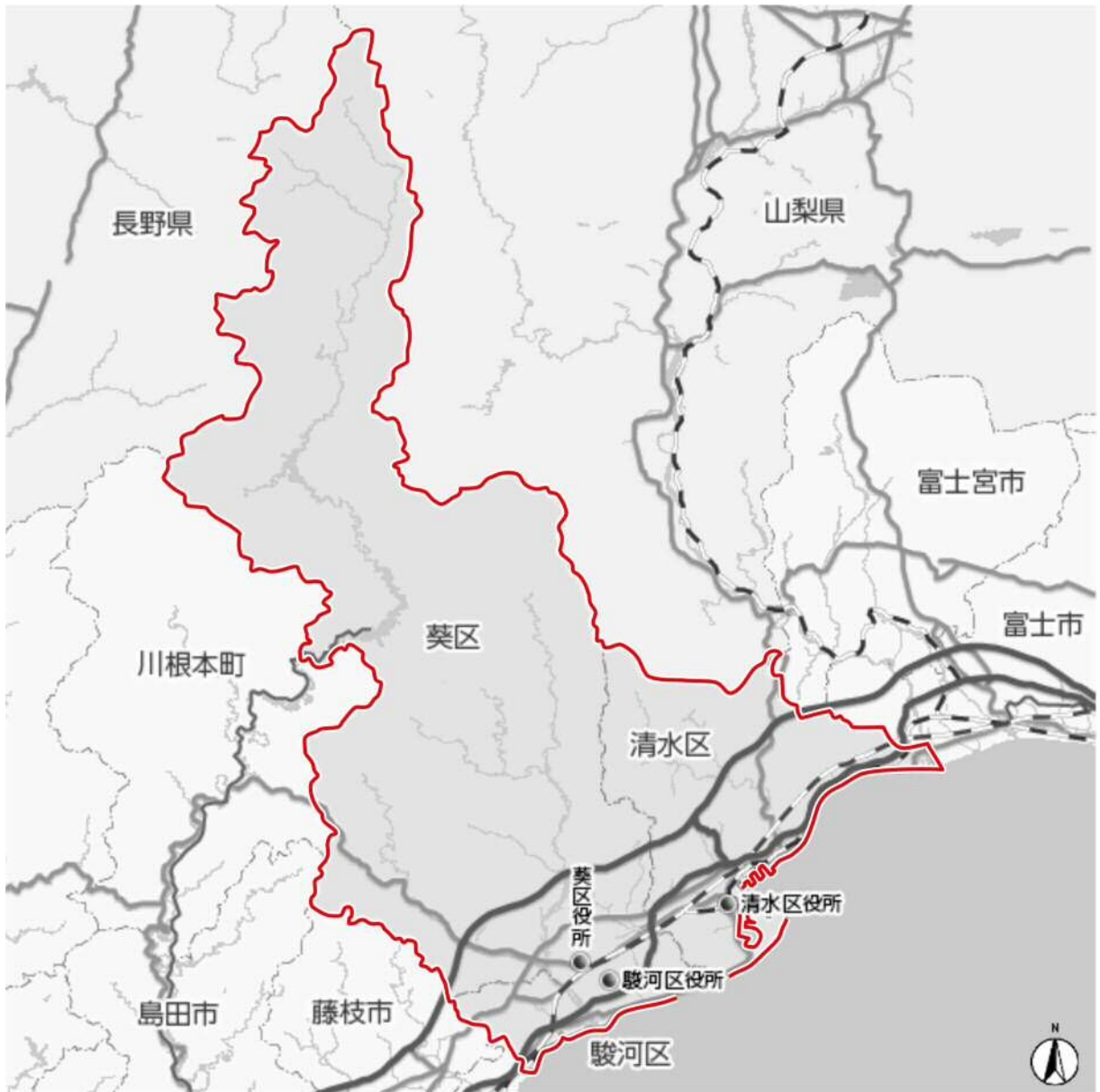
図 1-1 対象地域（静岡市全域）