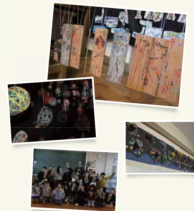
右上 左上 右下/田町小学校2・3・5・6年生の花火をイメージした作品 左下/駒形小学校4年生の安倍川を飾る竹灯りの作品

2023年に建設から100年を迎えた安倍川橋。東海に架かる橋とその周辺には魅力が盛りだくさん! このマップを持って散策に出掛けてみませんか。