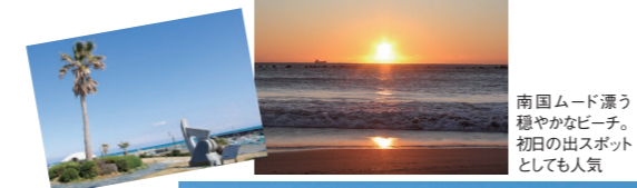
南国ムード漂う穏やかなビーチ。初日の出スポットとしても人気

☎0548-53-2623(牧之原市商工観光課) 🏠牧之原市相良 🍷400台(夏期有料)