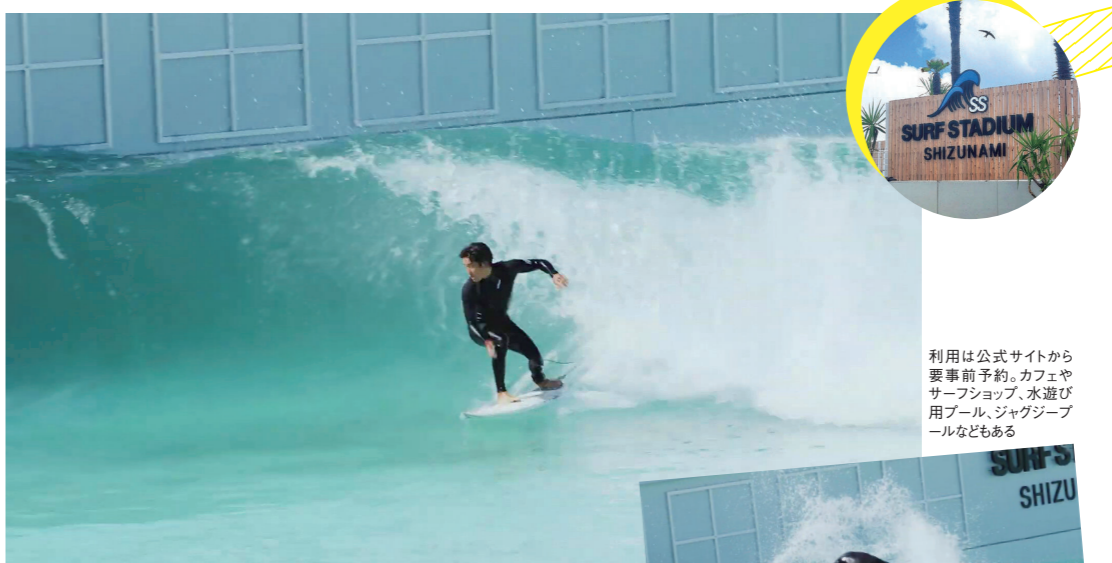
利用は公式サイトから要事前予約。カフェやサーフショップ、水遊び用プール、ジャグジープールなどもある