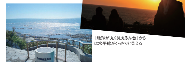
「地球が丸く見えるん台」からは水平線がくっきりと見える

☎0548-63-2550(燈台会御前崎支所) 🏠御前崎市御前崎1581 🕒灯台内見学9:00~16:00(時期により変動あり) 🚗無休 🍷参観寄付金 中学生以上300円 🍷92台