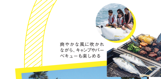
爽やかな風に吹かれながら、キャンプやバーベキューも楽しめる

☎0548-22-6685 🏠牧之原市静波2263-6 🕒10:00~18:00 (テイクアウトは~19:00) 🚗火曜 🍷13台