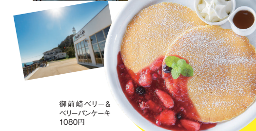
御前崎ベリー&ベリーハンケーキ 1080円