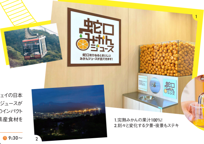
1.完熟みかんの果汁100%！ 2.刻々と変化する夕景・夜景もステキ

久能山東照宮と日本平を結ぶ日本平ロープウェイの日本平駅に併設する売店。蛇口をひねるとみかんジュースが出てくる「蛇口みかんジュース」は、味も見た目目のインパクトも満点。静岡のおみやげが各種そろそろほか、県産食材を使った和食も味わえる。 ☎054-334-2828 📍静岡市清水区草薙597-8 🕒9:30~17:00(テイクアウトは~16:00) 📅無休 🍷100台