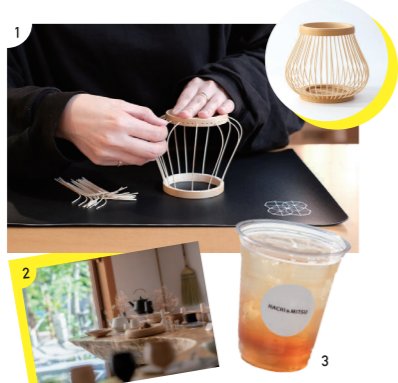
1.プログラムは50種類以上 2・3.工芸品を展示販売するショップやカフェも併設