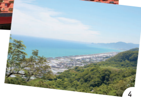
1.漆黒と極彩色のコントラストが美しい社殿 2・3.門扉や梁の装飾にも注目を 4.駿河湾を望む景色は家康公もお気に入りだった