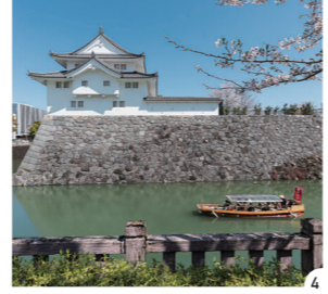
1~3.主に1階で静岡市の歩みを、2・3階で家康公と今川氏の歴史を紹介 4.家康公が暮らしした城を整備した駿府城公園もすぐ近くにある