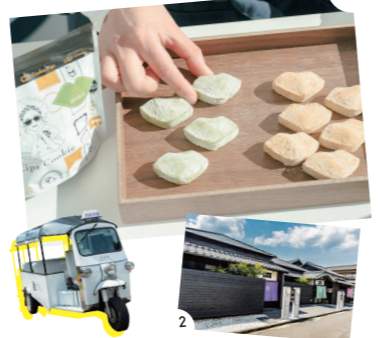
1.オープン当初から人気の軒「クッキーピグ」 2.近くには一棟貸しの宿も。宿泊予約をすると最寄り駅から宿までトクツクで送迎してくれる

海に面した路地裏にある2階建ての施設に、さまざまなジャンルのショップが集合。現在はクッキー、ヌードル、グルメパーガー、和菓子、アパレルなど10数軒が営業し、若者を中心に連日賑わいを見せている。2023年秋には敷地内の別棟もオープン予定。 📍静岡市駿河区用宗4-19-12 🍷店舗により異なる 🍷52台