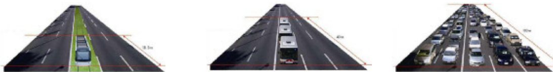
同じ人数をLRT、路線バス、自動車それぞれの輸送を想定したイメージ比較