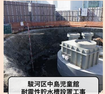
駿河区中島児童館 耐震性貯水槽設置工事