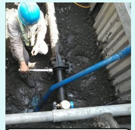
老朽化した水道管 の布設替えの様子