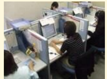
お客様サービスセンター の様子