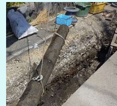
老朽化した水道管の布設替えの様子