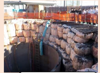
興津中学校に設置した耐震性貯水槽（生徒による見学の様子）