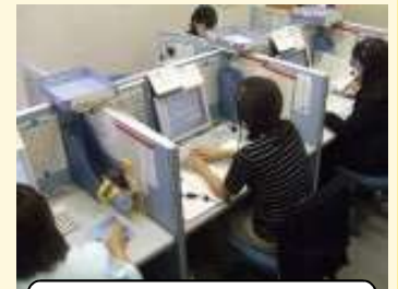
お客様サービスセンターの様子