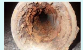
老朽化した水道管