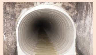
内面を補強した後の下水道管