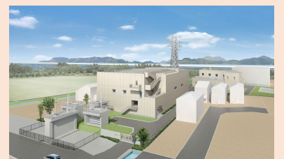
高橋雨水ポンプ場 完成イメージ図

→施工現場の台風被害や施工困難箇所により日進量が低下したため、 浸水対策に遅れが発生