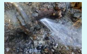
老朽化した下水道管から漏水