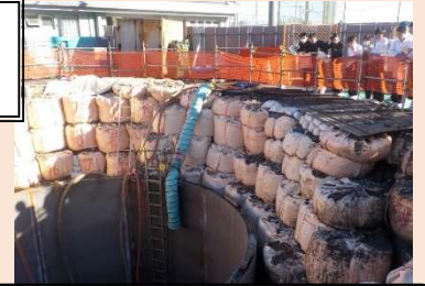
興津中学校に令和元年度に設置した耐震性貯水槽 (生徒による見学の様子)