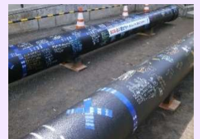
布設する管に未来へのメッセージを記入

老朽化した水道管や水道施設の更新や耐震化を積極的に実施し、水道基盤の強化を図るため、水道料金の改定（コロナ禍により10月に延期）