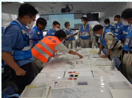
応急復旧計画作成の様子