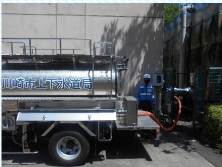
応急給水訓練の様子