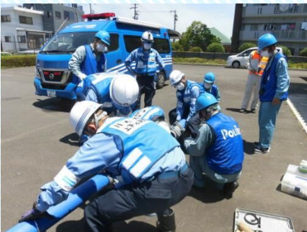
応急復旧訓練の様子