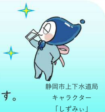
静岡市上下水道局 キャラクター 「しずみ」

水道水をご家庭で利用するにあたり、「直結給水方式」と「受水槽方式」があります。静岡市上下水道局では、「直結給水方式」をおすすめしています。 ※直結給水方式とは、水道管から直接蛇口まで給水する方式をいいます。 ※受水槽方式とは、水道管の水を一度受水槽で受けて、ポンプ等で蛇口まで給水する方式をいいます。 直結給水方式の水は外気の影響を受けにくいので、夏場でも冷たくておいしい水を飲むことができます。 静岡市のおいしい水を、ぜひ「直結給水方式」にて家庭でご利用ください！