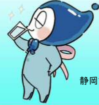
静岡市上下水道局キャラクター 「しずみい」