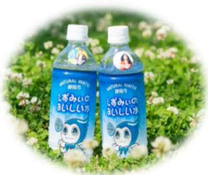
【配布した静岡市の水のペットボトル】

この水のペットボトル「しずみいのおいしい水」は、8月3日（金）に青葉シンボルロードで行われる上下水道フェアや市主催の事業等でも配布する予定です。手に取る機会がありましたら、ぜひ、静岡市の水のおいしさを味わってください。