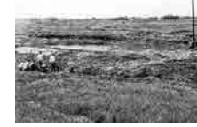
발견 당시 도로유적