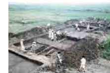
제6차 발굴조사 모습