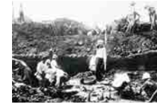
전후 발굴조사 모습