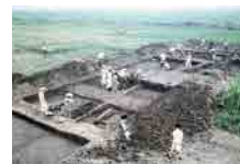
第6次挖掘调查的情形