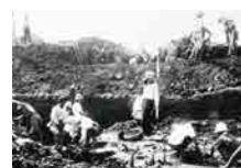
战后挖掘调查的情形