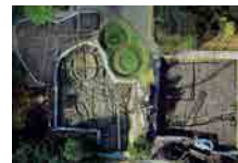
空拍再次挖掘调查地点