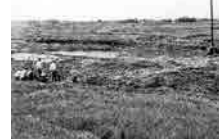
发现当时的登吕遗迹