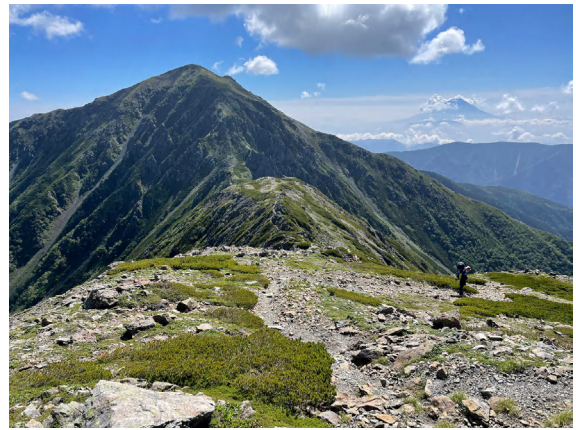
②悪沢岳 3141m (葵区・日本6位の高峰)