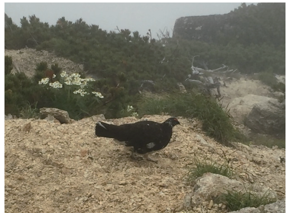
④ライチョウは森林限界より上で生息できる