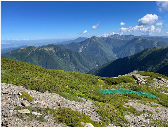
⑤荒川中岳の山頂付近、防鹿ネットが設置