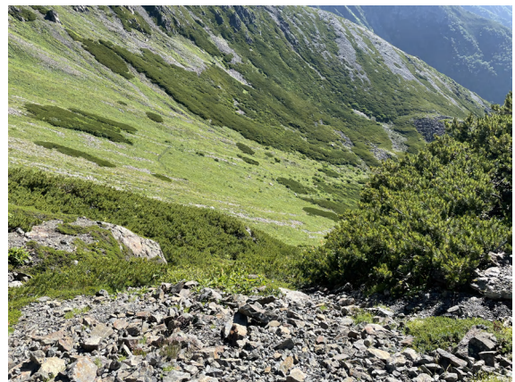
⑧荒川前岳南斜面のカルド地形。1万 1500 年前まで続いた最終氷期の氷河の圧力で U 字谷を形成している。高山植物群落が多く、JR 東海によって表層水の調査が行われた。