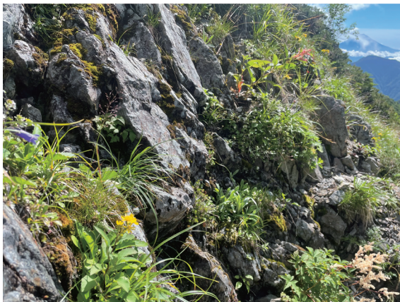
③標高 2800m 付近の高山植物 (森林限界上部)