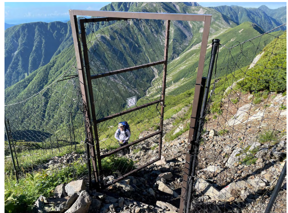
⑥前岳付近の防鹿柵は登山者の通過のため扉がある