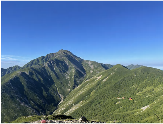
①赤石岳 3121m (葵区・日本7位の赤石山脈主峰)