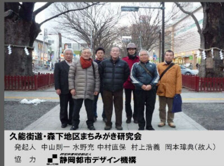
久能街道・森下地区まちみがき研究会