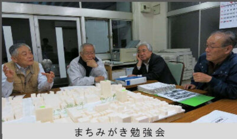
まちみがき勉強会