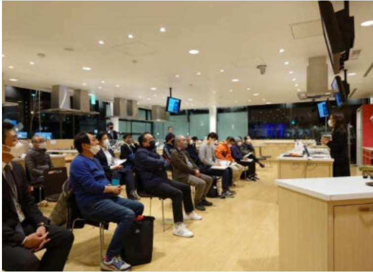
キックオフ講演会