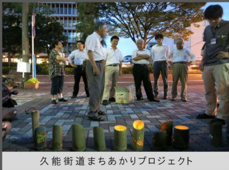
久能街道まちあかりプロジェクト