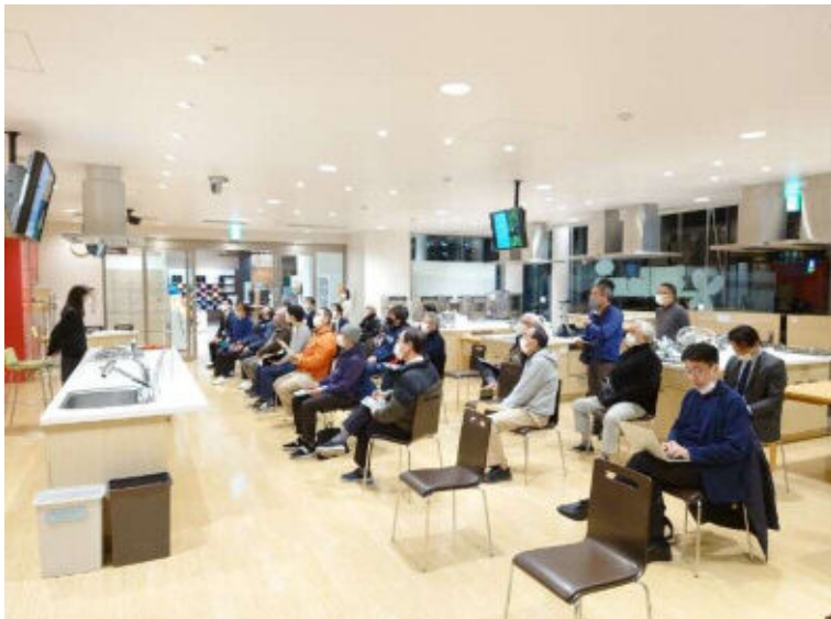
キックオフ講演会