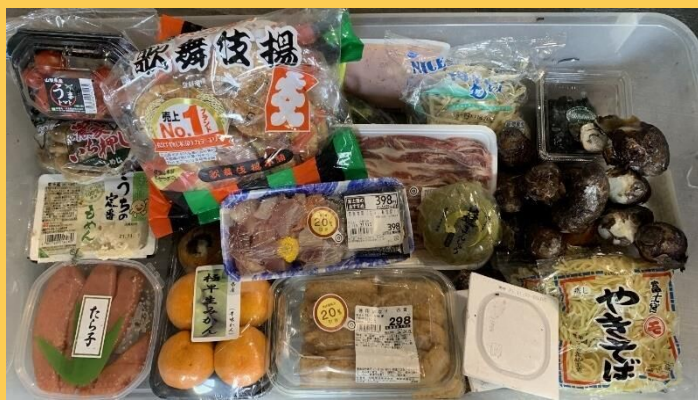
清掃工場に持ち込まれた手つかず食品↓

食品ロスとは、まだ食べられるのに捨てられてしまう食べ物のことです。日本で年間に発生している食品ロスは523万トンに上ります。(令和3年度推計 農林水産省推計) この量は、日本人一人当たりで換算すると、毎日お茶碗一杯分に相当します。そのうち家庭から発生している食品ロスは244万トンとなっており、日本で発生する食品ロスの約半分に相当します。