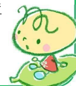
ごみ減量啓発キャラクター しずもちゃん