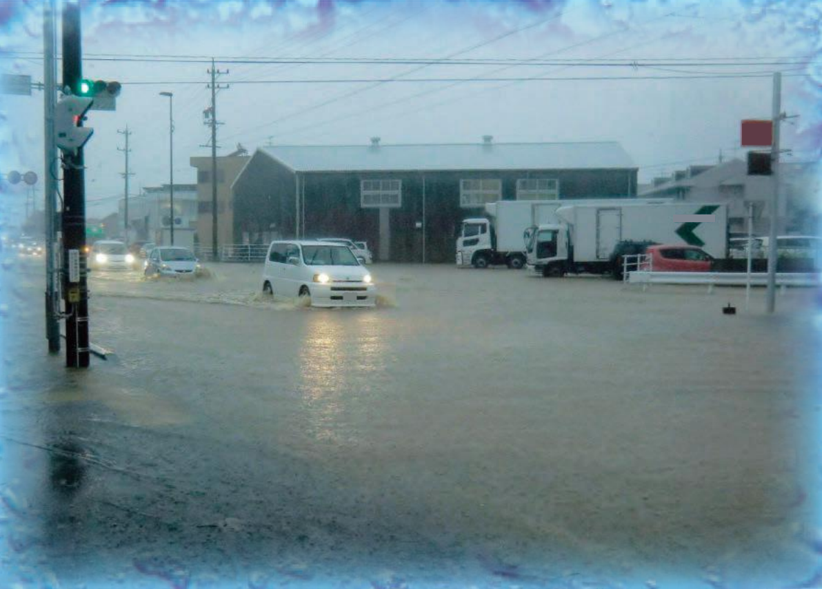
撮影日：平成26年10月6日 清水区横砂中町