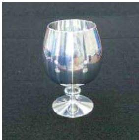
▲旋盤加工技術の高さを象徴する金属製のワイングラス。同社が掲げる「美しい製品づくり」が影射されています。