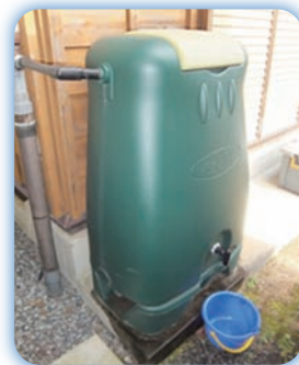
雨水貯留タンク 設置例